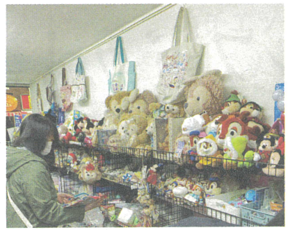
ディズニーファンにも知られたイベントという

買取業を手掛けるSOCIUS VALUE(大阪府大阪市)は中古デイズニーグッズ専門の催事で、「D-Joy販売会」を開催している。