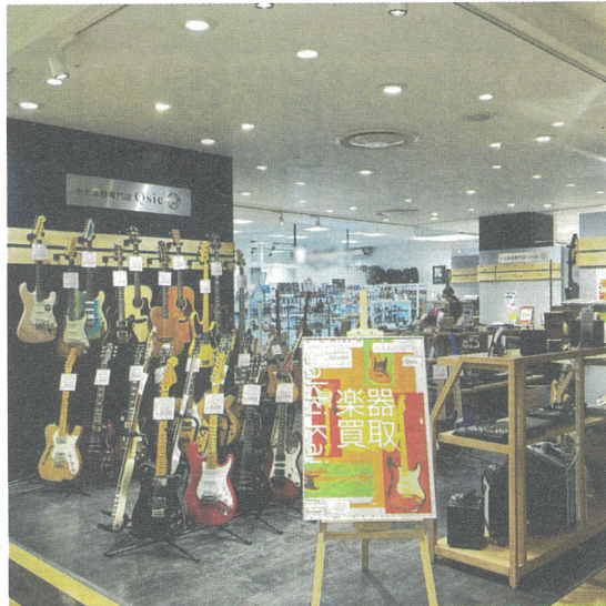
なんばマルイに中古楽器の買取専門店を設けた

「Q'sic」の屋号で中古楽器を扱うLUXTIS（ラグティス、兵庫県玉塚市）は国内の買取りを強化している。昨年、なんばマルイに中古楽器の買取専門店を出店した。半年という期間限定の出店予定だったが、好調を受け昨年10月常設の6階に位置する。買取りの商品は、販売と買